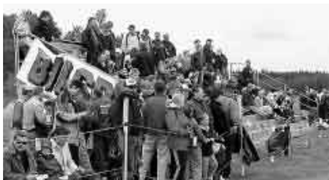
Åskådare på Feringe.