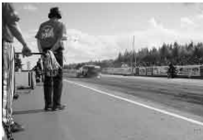
Eat my dust!