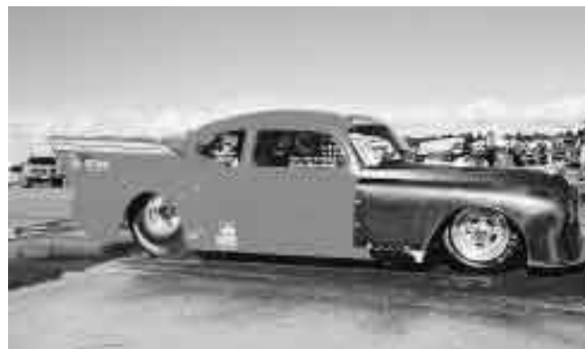
The old fiftyone.

Resultatlista anslås omedelbart efter samtliga körda finaler.