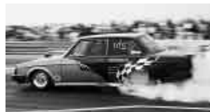
Johan Wigstrand i sin 240.

Sista anmälningsdag: 2002-08-12 (Efteranmälan i mån av plats samt efter- anmälningsavgift 500 kr)