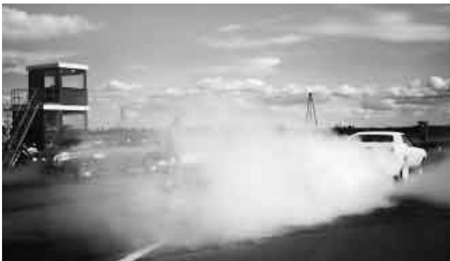
Rökigt på Macracet ifjol.