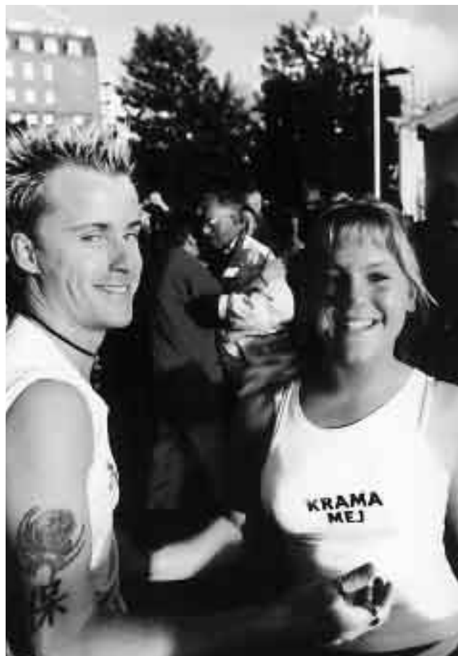
Dans på Packhusplatsen.