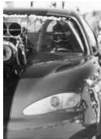
Lugnet före stormen.

Anmälan skickas till: SHRA-Nyköping Fruängsg. 6E 611 31 NYKÖPING