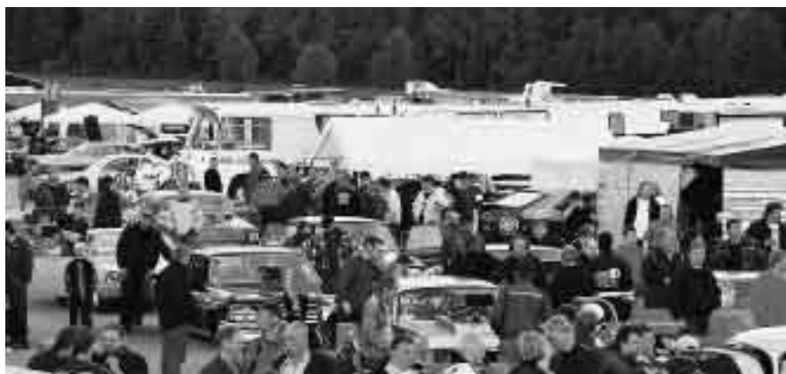
Publikvimmel på Feringe Dragway 2001.