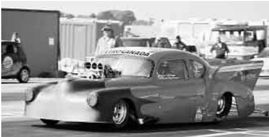
Fjölårets cupsegrare, Top Doorslammer – Kent Trenneman.