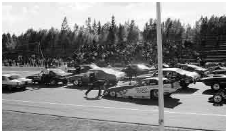
Ready to start!