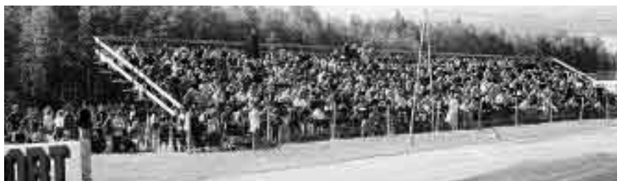
Välbesökt under Midnight Sun International's 2001.

SHRA-Luleå har funnits sedan 1972. Målsättningen var redan från början att arrangera egna dragracingtävlingar. Vi hälsar Dig och ditt team varmt välkomna till en oförglömlig upplevelse på Pite Dragway!