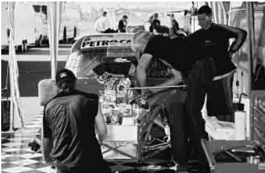
Kent Trenneman mekar med "The Old FiftyOne"...