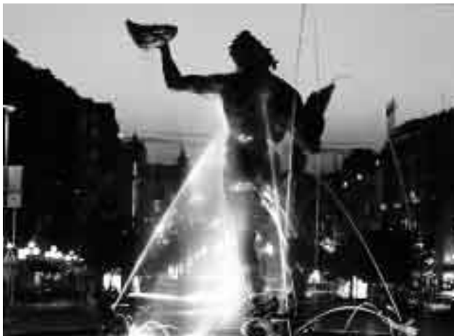
Poseidon i skymningen...