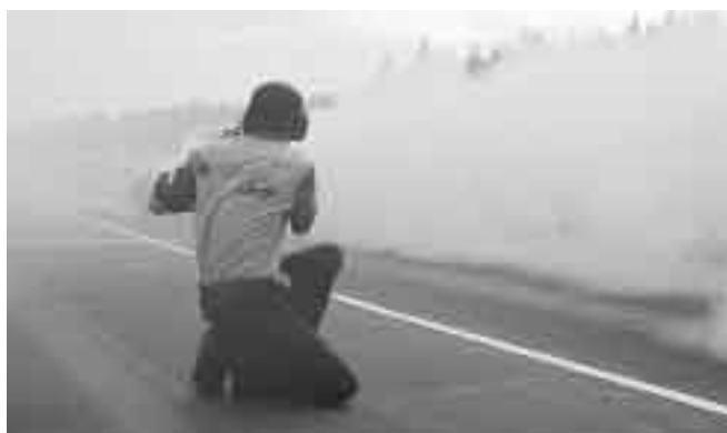
Gone with the wind...