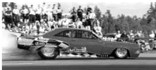
Mousetrap Racing i sin ovanling Fairlaine.