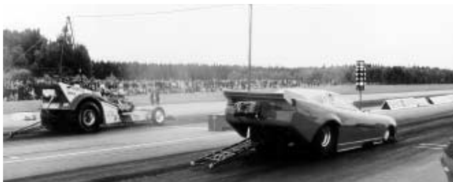
Super Modified bjuder på de flesta biltyper.