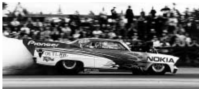
Patrik Wikström lägger en dimridå över Dalarna.

Resultatlista anslås ca: 30 minuter efter avslutade finaler - därefter prisutdelning. Tider angivna med reservation för ev. ändringar