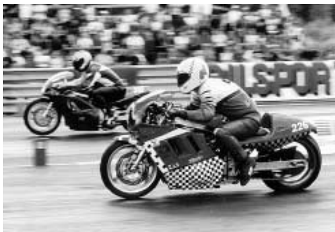
Först i mål vinner, Pro Street Bike

Besiktning: På returbana till vänster om infarten Depå: Nere vid banan bakom starten. MC till vänster om start. Drivmedel: Påfyllning i depå. Eventuellt oljespill hålls i för ändamålet avsett kärl. Släp: Parkeras på anvisad plats. Förarmöten (obligatoriska!): Upprop kommer att ske. De förare som ej deltar i förarmöten, äger ej rätt att starta i tävlingen. Anslag etc: Vid prispallen. Kval-/resultatlista kommer att anslås efter tävlingsdagens slut.