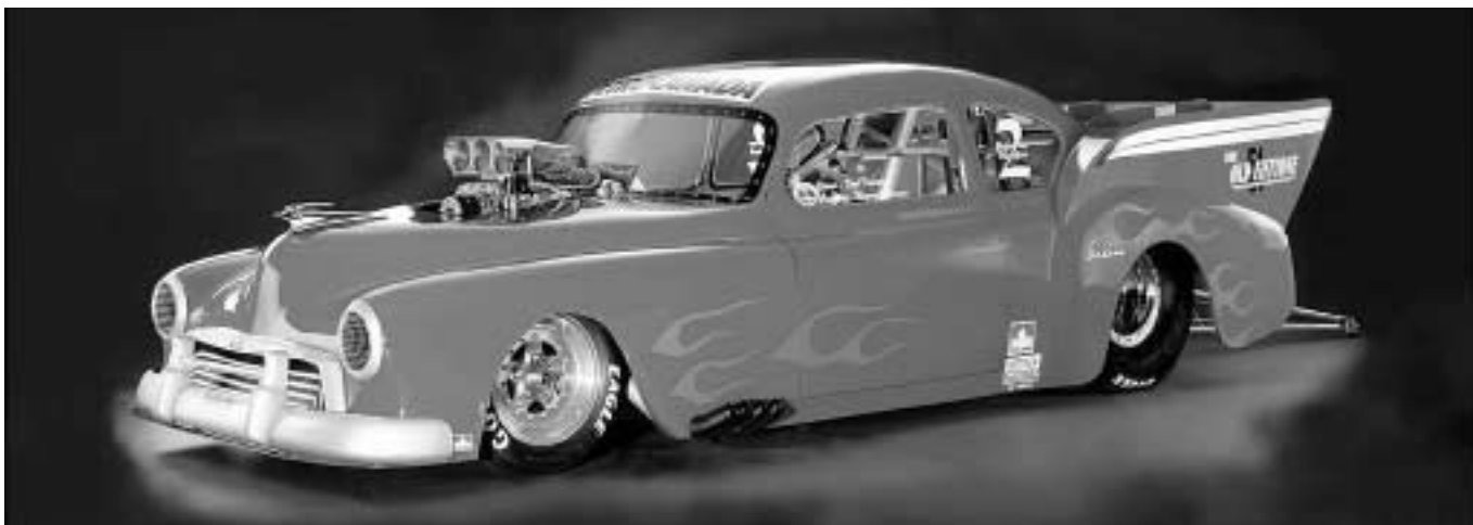
The Old Fiftyone i fotostudion.

Sista anmälningsdag: 2001-08-14 (Efteranmälan i mån av plats samt efter-anmälningsavgift 500 kr)