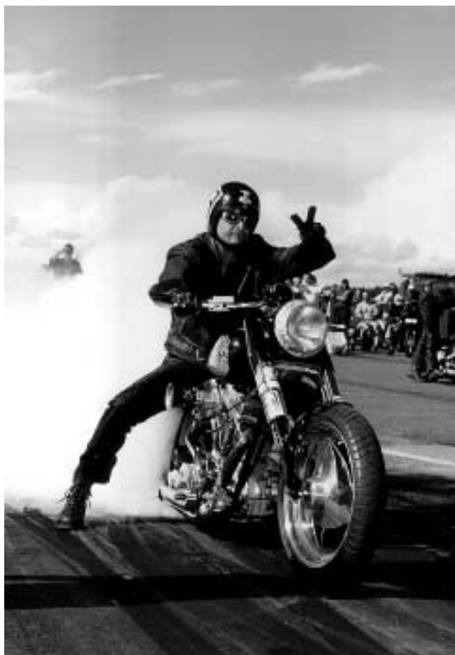
Segerviss deltagare under Masracet 2000.