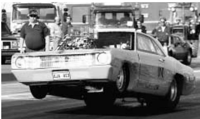
Allt för publiken.