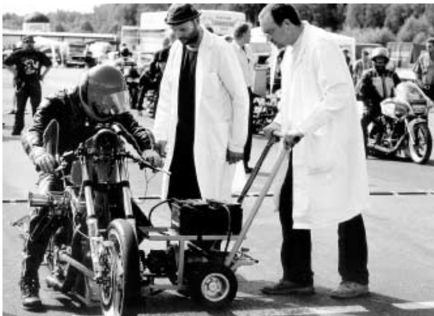
Kontroll av motorcykel innan lopp.

I övrigt ser väl startfältet ungefär likadant ut som föregående säsong. Vi vet redan i dagsläget att det kommer lite nya förare. Två har vi redan berättat om, men det kommer fler! Det har varit en positiv utveckling av klassen genom åren. Ännu så länge har vi inte minskat i antal utan ökat hela tiden. Vi får hoppas att den trenden fortsätter att hålla i sig.