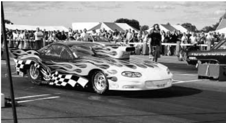
JH Racing med sin makalösa Camaro.