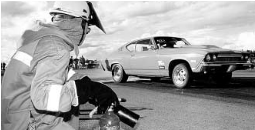
Rescue Teamet i beredskapsställning.