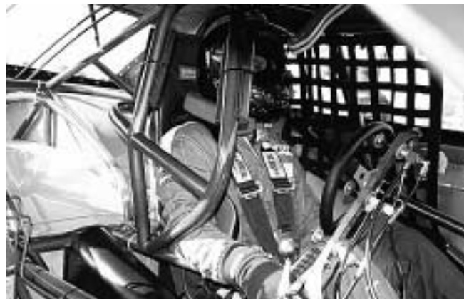
Fit for fight!

Resultatlista anslås ca 16.30, därefter prisutdelning. Med reservation för ev. ändringar.