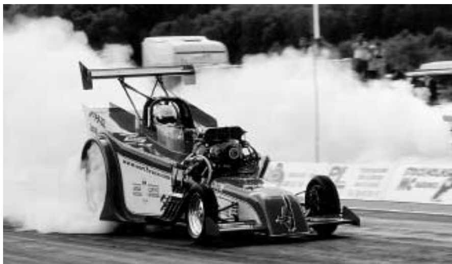
Dragster från förra året.