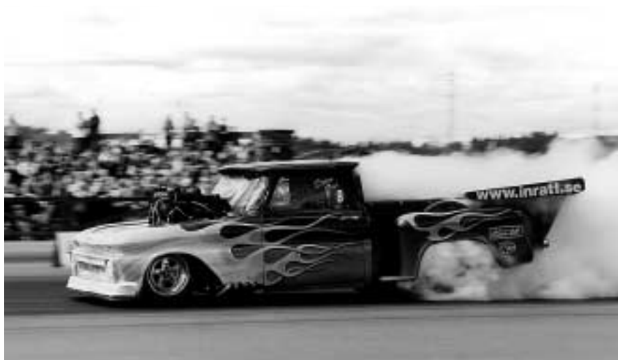
Cupvinnaren 2000 på Masracet ifjol.