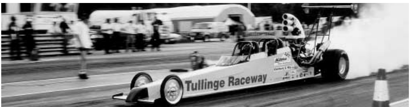
Europas enda two-seat dragster i full aktion.

SHRA Stockholm kom i kontakt med NPSC under 1996 och 1997 kördes den första tävlingen på hemmabanen Tullinge Raceway. Tävlingen på Tullinge är årets höjdpunkt för klubben och tillsammans med team och förare erbjuder vi en helg att minnas.